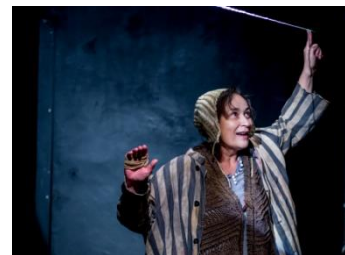
Júlia –Párbeszéd a szerelemről

Az Újvárosi esték alkalmával a pódiumjátékoktól, az önálló esteken keresztül a nagyobb létszámú kamaraszínházi előadásig nyújtottunk minőségi kulturálódási lehetőségeket látogatóink örömteli meglepedésére. Az estek különlegességét bizonyítja az is, hogy két 2019-ben Jászai Mari-díjjal kitüntetett művészt köszönthettünk fel Pataki András és Gál Tamás személyében. A nyolc előadásra összesen 746 látogató érkezett. Az Újvárosi esték sorozat kedvezményes díjú látogatását biztosító „Újváros kulturájáért” pártoló tagsági kártyát ebben az évben 45 fő váltott. Az elmúlt évek során kialakult állandó törzsközönségünk köre tovább bővült.